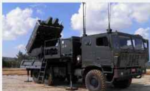
GBAD MERAD (Ground Base Air Defence Medium Range Missiles Systems)